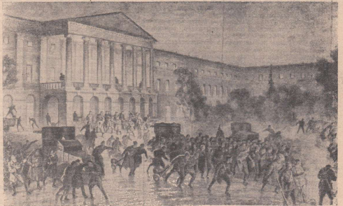
Фрагмент картины художника В. А. Кузнецова «Смольный в Октябрьские дни».

Но оставалось еще гнездо контрреволюции — Зимний дворец, где отсиживались министры Временного правительства.